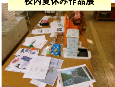
校内夏休み作品展