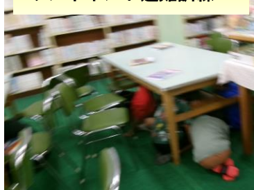
ワンポイント避難訓練