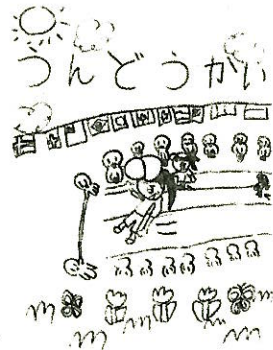
1-1 作: O.M さん