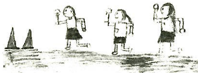
1-1 作: K.H さん