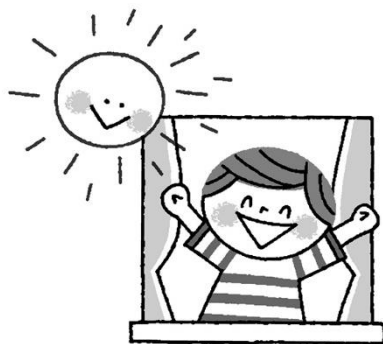
はやお 早起きしてあさひをあびる