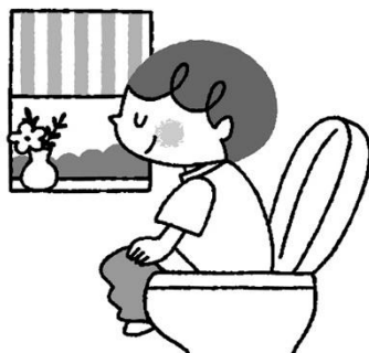
まいあさ 毎朝きもちよく排便する