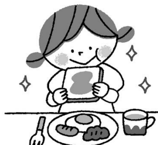
ちようしよく 朝食をたべてエネルギー補充