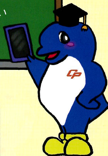
千葉県警察マスコットキャラクター 『シーポック』