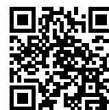
連絡メール2 保護者ログイン

* 保護者登録しているメールアドレスがご利用できない場合は、パスワードの再設定ができません。