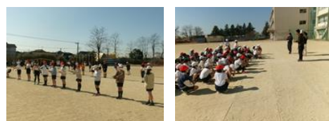
4年生 学年縄跳び大会