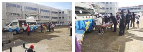
3年生 移動交番教室