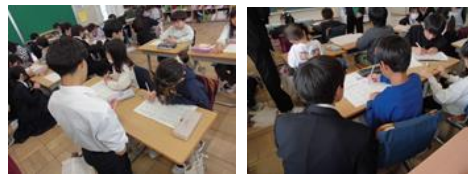
2年生 根木内中学校3年生との交流(算数)