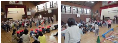
1年生 保育園児との交流