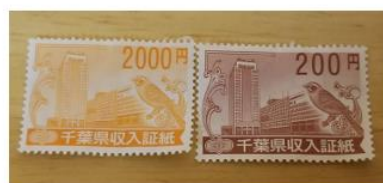
千葉県収入証紙見本

千葉県収入証紙にて受検料（全日制 2,200 円、定時制 950 円）支払いますので、収入証紙を用意ください。収入証紙は購入できる場所が限られていますのでご注意ください。今年度より警察署、運転免許センターでの収入証紙の扱いは中止となっています。六実中から比較的近い場所で購入できるのは、柏南自動車教習所、動物愛護センター、松戸東自動車教習所などです。その他購入可能場所「千葉県 収入証紙」でWEB 検索すると確認できます。