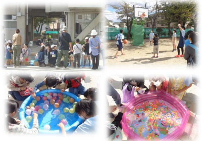
楽しいふれあいまつりの様子

子供達が毎年楽しみにしているふれあいまつり。今年度も感染症の対策から2部制とし、保護者の参加は可能としました。お天気が暑すぎず寒すぎず風もふかなくて過ごしやすい日で良かったです。昨年度PTAに購入していただいたバスケットゴールでのシューティングゲーム、ペットボトル輪投げ、スリッパとばし、ヨーヨーすくい、人気のスライムづくり、バザーのコーナーでは、おもちゃや本、手作り品などがあり、子ども達は作ったり、遊んだり、買い物したりと楽しく過ごしました。保護者の方もたくさん来ていただき子供達と一緒に参加している姿が見られました。6年生はA・Bに分かれ、各コーナーを手伝いました。最上級生として頑張る姿を下級生に見せることができました。PTA本部、役員、おやじの会の方々、計画から始まり準備、当日の運営や後片付け等まで本当にありがとうございました。