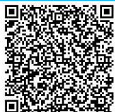
【講師登録電子申請】