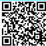
【東葛飾教育事務所HP】