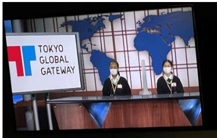
カッコいいアナウンサーに変身