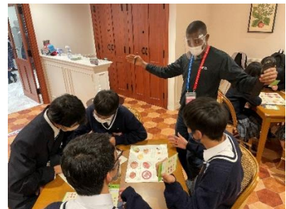
レストランで注文