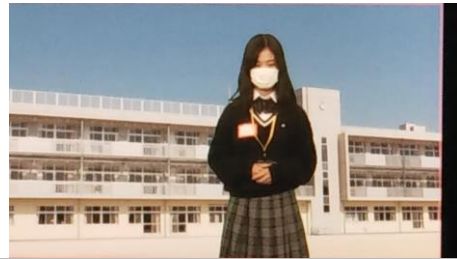
学校から中継するリポーターに変身