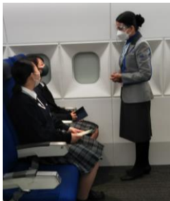
CA さんに新聞や薬を持ってきてくれるようお願いしています