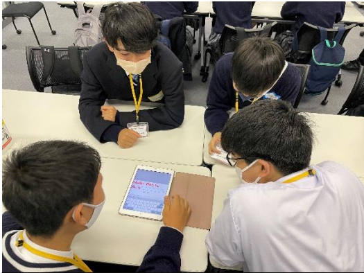
まずは原稿（カンペ）を作っています