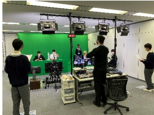
グリーンバックの前で撮影すると…