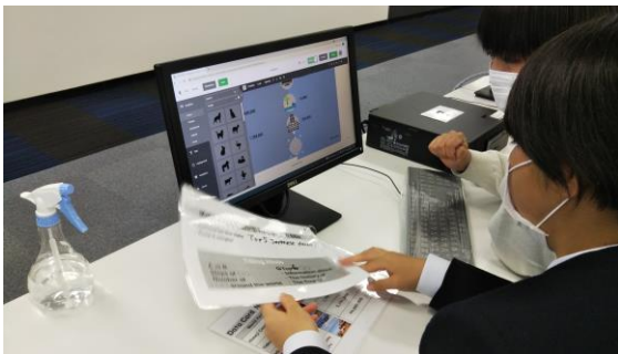
表、グラフ、アイコン、図などを使ってわかりやすく情報を伝える工夫をします。