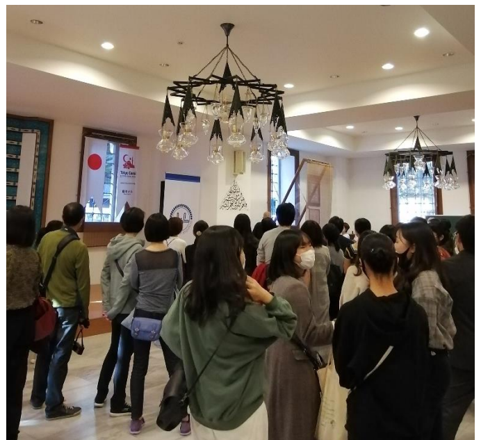
ツアー中の生徒たち。