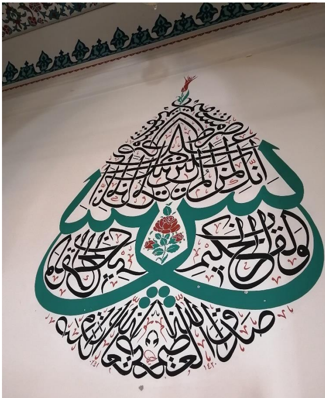
モスク内部の壁面装飾。文字が模様のようにデザインされている。