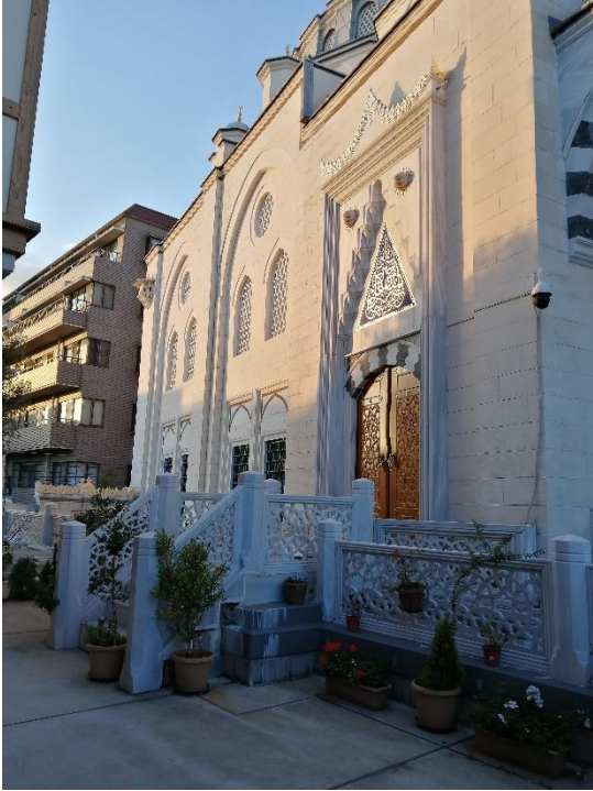
モスク礼拝堂の外観

国際人文科1年8組では、マレーシア研修中止の代わりに行事として、10月24日(土)に、東京ジャーミィ・トルコ文化センター研修へ行って参りました。14時半から一般見学者とともに見学ツアーに参加し、途中、アザーン(礼拝開始の合図)があり、礼拝の様子も見学することができました。モスクの外装、内装ともに材料を全てトルコから取り寄せたとのことで、異国情緒あふれる建物でした。生徒たちはガイドの方の話をよく聞き、今後のインドネシア留学生受け入れやイスラム新聞作りにも意欲を見せています。インドネシア留学生の宗教がイスラム教なので、留学生受け入れへの良い動機付けになりました。