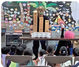
ちば子ども大学の様子