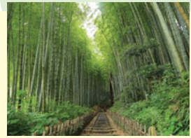
実際の風景(佐倉市)

大人気ゲーム「FORTNITE」をプラットフォームとして、バーチャルで再現された4市を巡り、ミッションをクリアする体験型観光ゲーム。タイムアタックレース形式で、パルクールなどのアクション要素を楽しみながら歴史的名所などを巡ります。