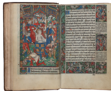
フリリップ・ピグーシェ印刷、シモン・ヴォストル出版『時禱書』1502年頃 印刷博物館蔵

印刷博物館(東京都)のコレクションから、印刷物の美しさをテーマに印刷の歴史を多角的に探ります。