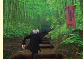
プレイ画面のイメージ

今夏、eスポーツ大会も開催予定！ 詳細は北総四都市江戸紀行活用協議会の 公式SNSをフォローしてお待ちください！