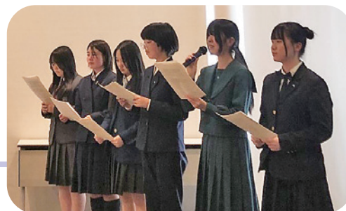
代表生徒が大会基本方針案をプレゼンする様子