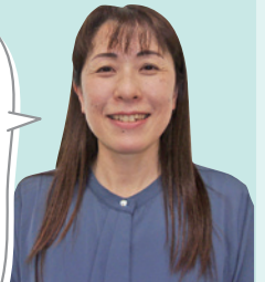
松戸向陽高校で福祉を教える「トクメン先生」

前職で介護施設の介護福祉士として勤務していた経験を生かし、福祉の現場のリアルな状況を生徒に伝えることができます。 また、教師・生徒の関係だけではなく、先輩・後輩としても資格取得に向けてサポートできます。