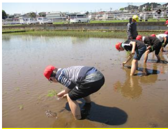
5年 田植え体験学習