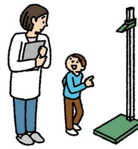
室内の備品などに 勝手にさわらない