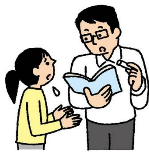
担任の先生に ことわってからくる