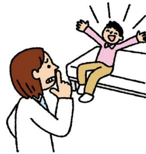
保健室ではさわがず しずかにすごす