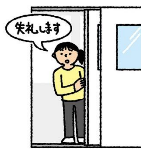
入室退室時には あいさつをする