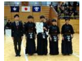
【剣道部男子団体敢闘賞】