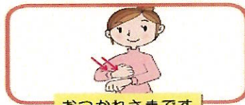
おつかれさまです