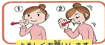
よろしくお願いします