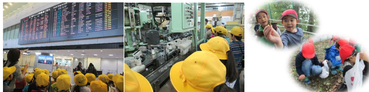
4年校外学習 成田空港