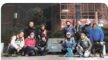
夜通し頑張ったメンバーたち