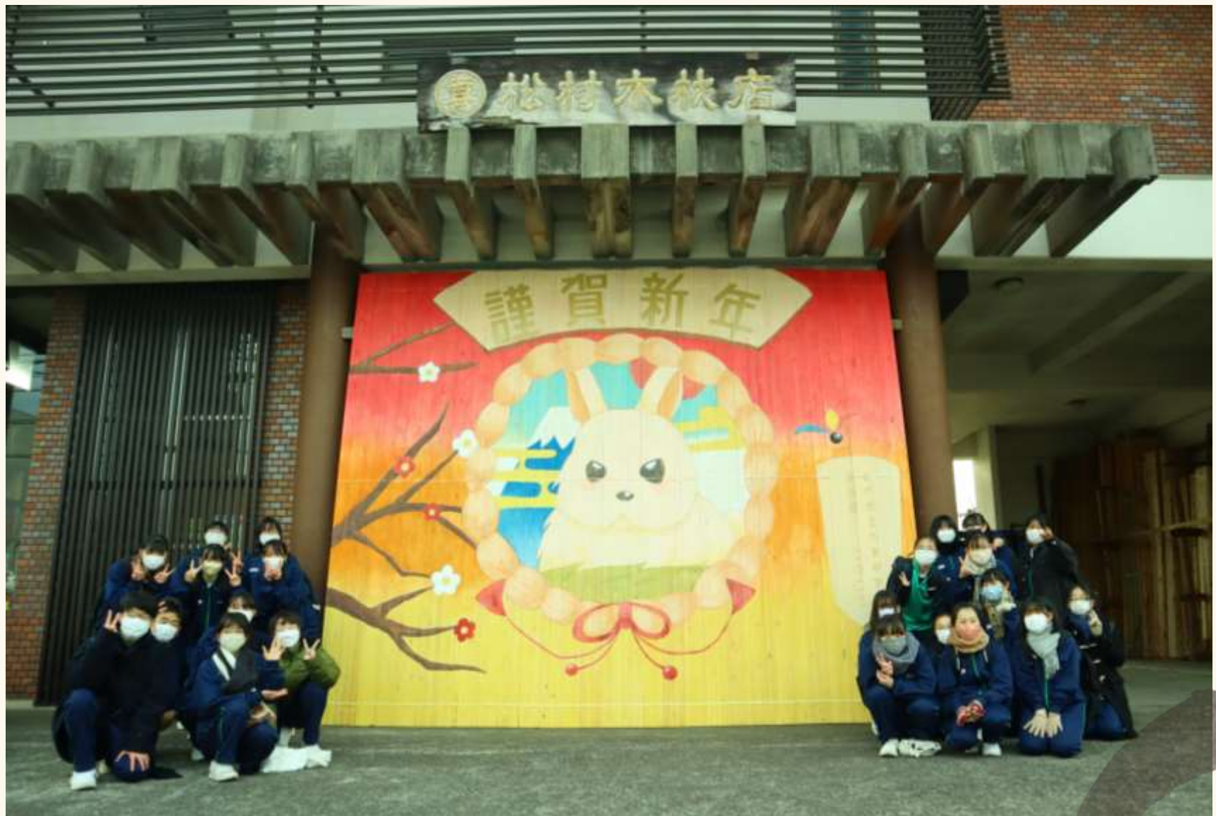
松村木材店 × 六実中美術部 年賀看板2023 2022年12月28日 ~ 2023年1月5日 設置