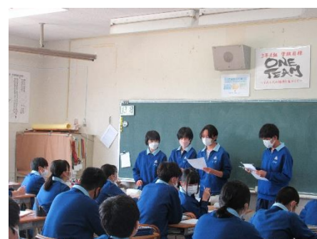
↑班長部会での持ち物の討議