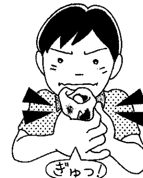
切り傷は 清潔なガーゼを当てて押さえる