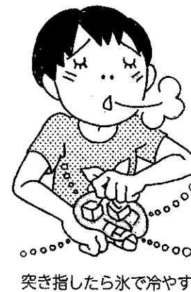
突き指したら氷で冷やす