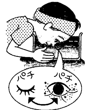
目にゴミが入ったら 洗面器に張った水で目を洗う