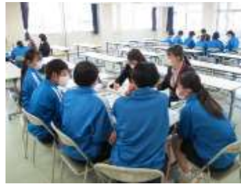
3年生修学旅行班別日程