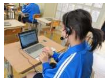
全国学力学習状況調査（英語）