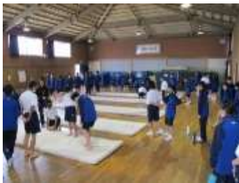
スポーツテスト（全学年）

《1年生の感想から》 私たちのために、2・3年生がおもしろくわかりやすい委員会と部活動の説明をしてくれてありがとうございました。2・3年生のみなさんのおかげで中学校生活がますます楽しみになりました。委員会も部活動も一杯頑張りたいので、これからよろしくお願いたします。