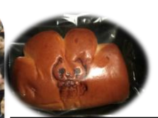
人気の こがねこのおてて