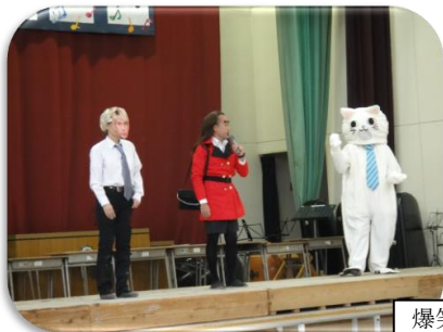
爆笑のオープニングセレモニー

おかげさまで、子どもたちの笑顔があふれる一日となりました。心からお礼を申し上げます。ありがとうございました。