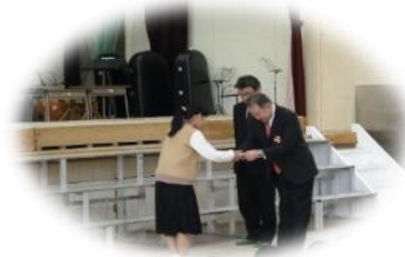
贈呈式 児童会長が代表で受け取りました

11月18日（土）の小金っ子まつりのオープニングセレモニーの中で、地域の方からいただいたサッカーゴールの贈呈式を行いました。ピカピカのゴールに、小金っ子の目も輝いていました。体育の授業などで、大切に使用させていただきます。