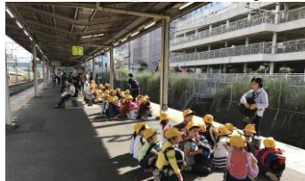
駅ホームで電車を待ちます。 リュックは前に背負っています。