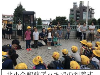
北小金駅前デッキでの到着式