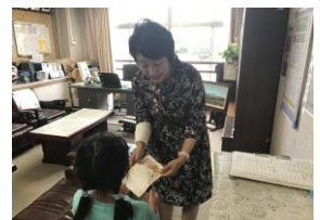
実行委員が校長室にしおりを届けてくれました。

さて、この後、各学年の校外学習と6年生の修学旅行が控えています。さらに歌声集会やマラソン大会など大きな行事が続きます。