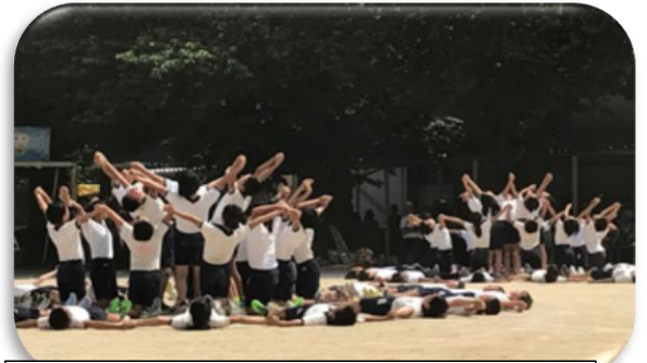
「My Life—軌跡・輝石・奇跡—」の一コマ

負けても、力いっぱいやってたくさんの人に喜んでもらえたと、思うから、今年の運動会はやはり、今までの運動会の中で、一番楽しかったと思う。