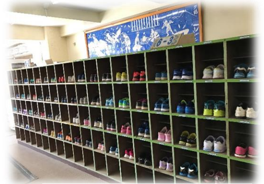
【6年生の靴箱の風景です】