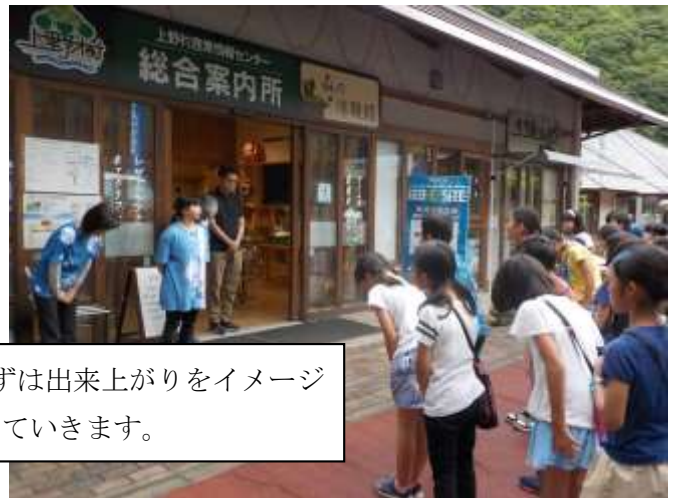
藍染体験の開始。まずは出来上りをイメージしながらデザインしていきます。