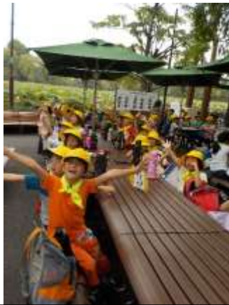
モノレールに手を振る子どもたち