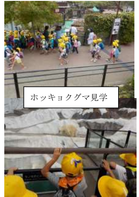
ホッキョクグマ見学